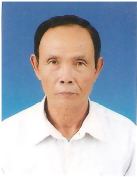
ឧបាសក នាយ មាន កវីនិពន្ធកំណាព្យ អតីតបុគ្គលិកសិក្សានៃក្រសួងសិក្សាធិការជាតិ